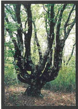
山頂附近の大ブナ

将来にわたってこの貴重な森林を活用・保存していくために、火の後始末、ゴミの処理など、利用される皆さんの御協力をお願い致します。